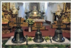
Doplnění zvonové soustavy farního kostela sv. Vavřince v Bystřici nad Pernštejnem