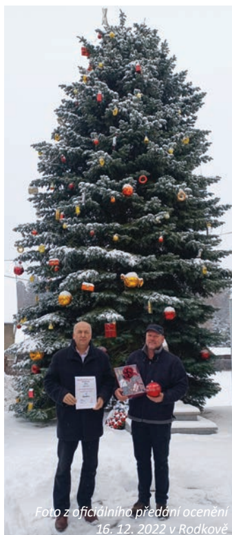
Foto z oficiálního předání ocenění 16. 12. 2022 v Rodkově