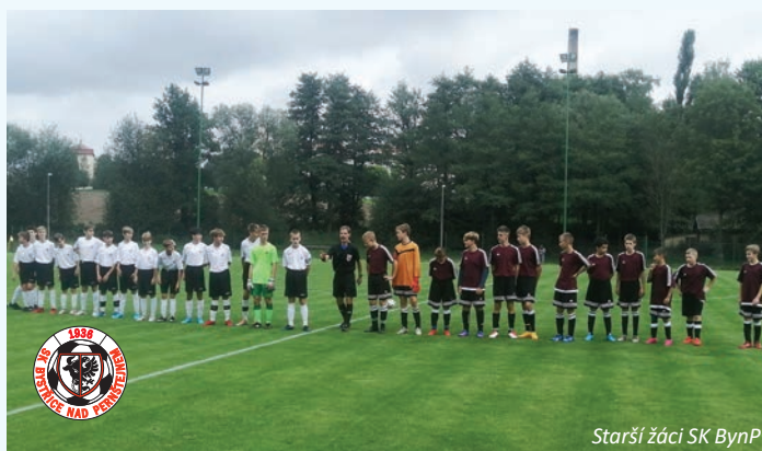
Starší žáci SK BynP