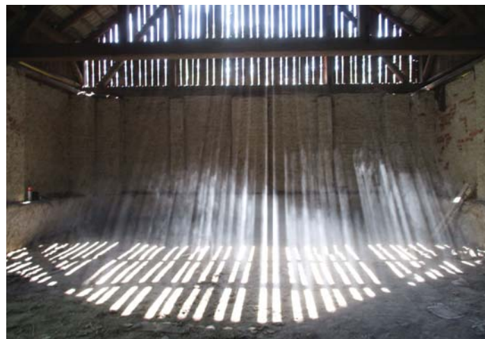
Jáchym Čech: Sluneční varhany / 1. místo - juniorské téma „Ta se mi ale povedla“