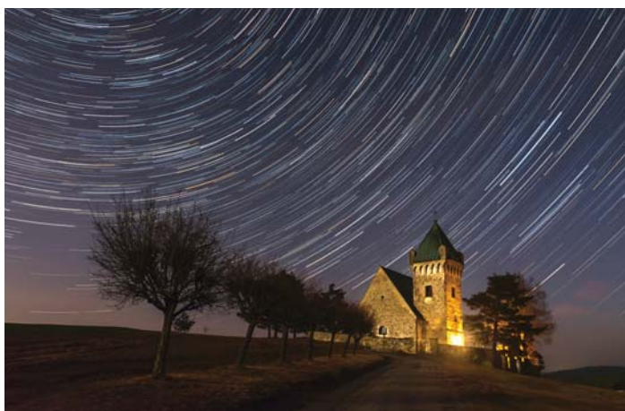
Jiří Hudec: Nebeské spojení / 1. místo - regionální téma „Portrét Bystricka“