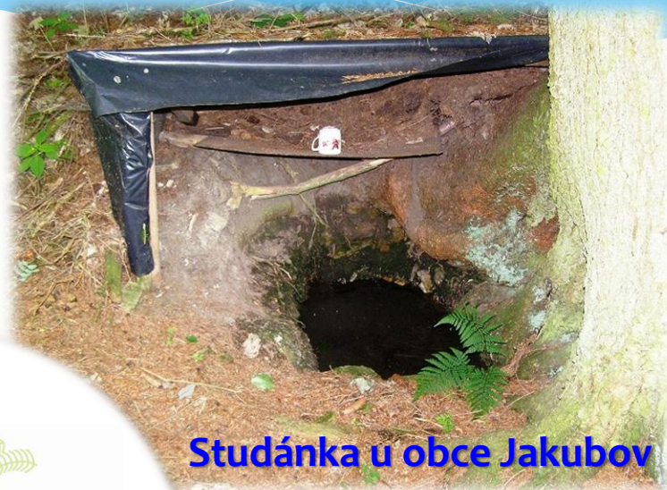
Studánka u obce Jakubov