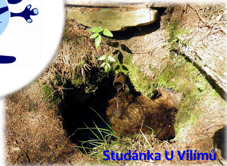
Studánka U Vilimů