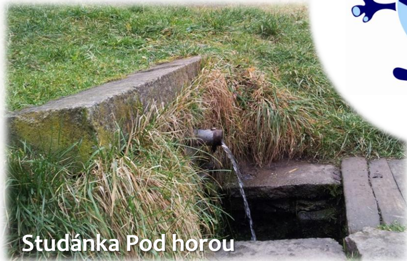
Studánka Pod horou