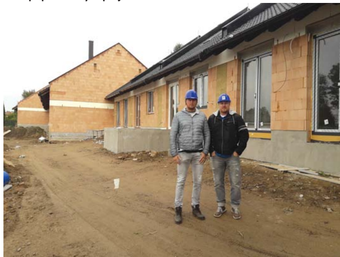
Jednatelé společnosti STAVOFLOS s.r.o. před řadovými domy na ulici Antonínka