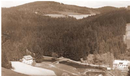
Pohled se stráně na část Hamry