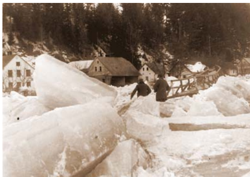
Jarní tání na Svatce