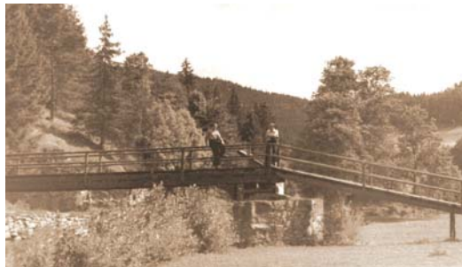
Lávka přes Svatku nad splavem