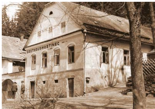
Vyhlášený Juříkův hostinec