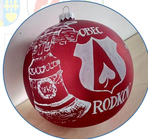
Baňka pro letošního vítěze – kdo ji chcete, zapojte se!