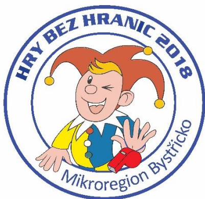
Logo letošního 5. ročníku.

Dne 8.9.2018 se v obci Dalečín uskuteční již 5. ročník Her bez hranic. Letos v soutěžních řadách uvítáme hned dva nováčky, obec Velké Janovice a Horní Rožínka, celkem se her bude účastnit 11 členských obcí z našeho regionu, které vzájemně poměří své síly v několika soutěžních disciplínách. Již tradičně bude jednu ze soutěžních disciplín připravovat také Mikroregion Bystřicko, bude se jednat o vědomostní disciplínu, při které se zaměříme na náš region a na znalosti soutěžících. Jedno je však jisté už nyní, kdo přijde, bude se určitě skvěle bavit, ať už jako soutěžící nebo jen jako divák. Pro všechny máme jako každý rok připraven bohatý doprovodný program i občerstvení. Přijďte s námi zažít zábavu, která nemá hranic.