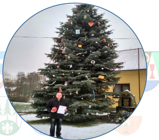
Vítězný strom druhého ročníku - obec Rodkov

Už teď se těšíme, na další ročník soutěže a doufáme, že účast bude minimálně stejná, jako loni a že obce už nyní přemýšlí nad svojí vánoční výzdobou.