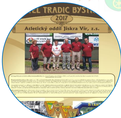
Památeční panel pro loňské vítěze z obce Vír

Počátkem roku 2018 byla vyhlášena výzva na „Nositel tradic roku 2018“. Cílem akce je posílit sounáležitost nás všech s regionem, ve kterém žijeme, s jeho historií. Uvědomit si, co je pro náš kraj charakteristické a vyzdvihnout občany, kteří k uchování těchto charakteristických rysů přispívají. Ocenit ty, kteří udržují a obnovují tradice Bystřicka, případně je vytvářejí, a tím podpořit další obyvatele, zejména mládež, k činnosti pro obec, pro mikroregion. V tomto roce se koná již 7. ročník této akce.