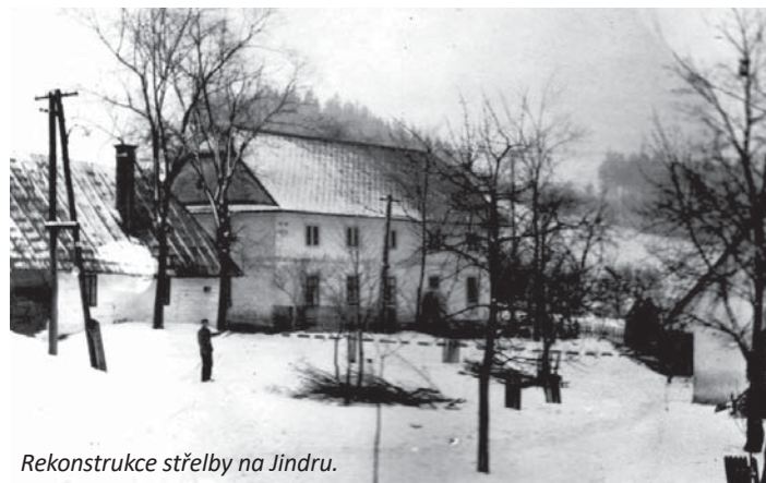
Rekonstrukce střelby na Jindru.