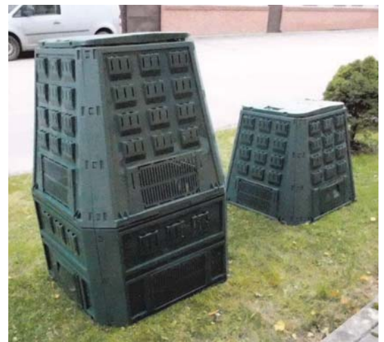
TS města a.s., K Ochozi 666, Bystřice n. P.