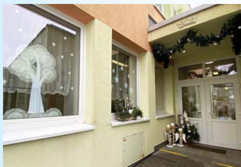
1. MŠ Pohádka

cům byly předány věcné dary a ostatním zúčastněným děkujeme za jejich účast v soutěži.