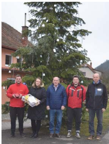
Fotografie z oficiálního předání ocenění a vánoční baňky dne 18. 12. 2020 v Dolním Čepí.