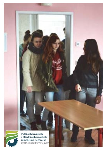
Vyšší odborná škola a Střední odborná škola zemědělsko-technická Bystřice nad Pernštejnem