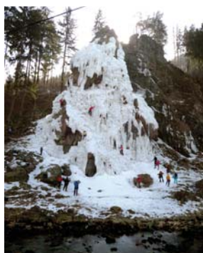
Ledová stěna ve Víru

Asi 1,5 km odtud směrem k Dalečínu najdeme nepojmenovanou vyvýšeninu s krásným výhledem na Chudobínskou borovici, Strom roku 2019 a Evropský strom 2020. Osobně bych ji nazval Peňázovou vyhlídkou . (pokračování příště) Hynek Jurman