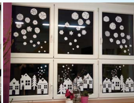
3. ZŠ a MŠ Unčín