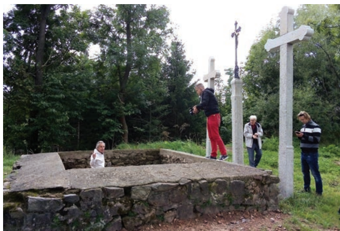
Bystrická šibenice se stala součástí minidokumentů o tajemných místech Moravy.