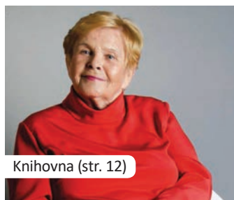
Knihovna (str. 12)