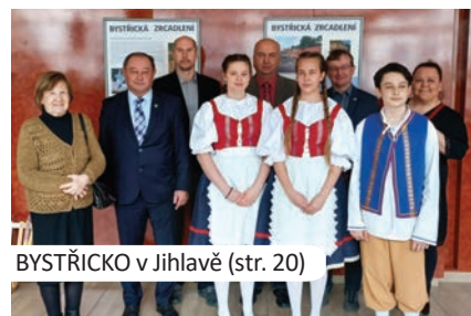
BYSTŘICKO v Jihlavě (str. 20)