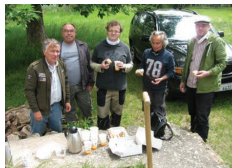
I při výzkumu se našla chvilka na sladkou pauzu.