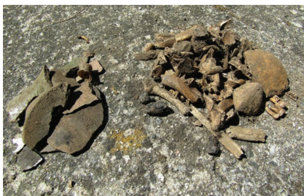
První nálezy kostí a keramiky z bystrické šibenice.