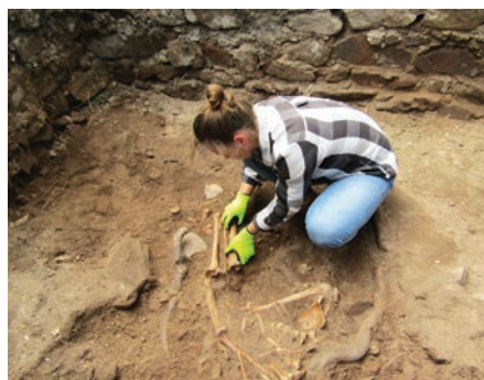
Všem kostem byla věnována náležitá a pečlivá pozornost.