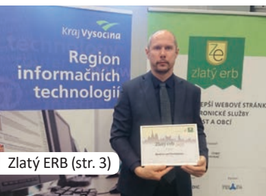
Zlatý ERB (str. 3)