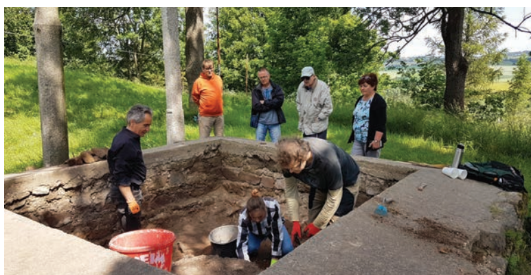
S novinkami jsme seznamovali zájemce i zástupce města.