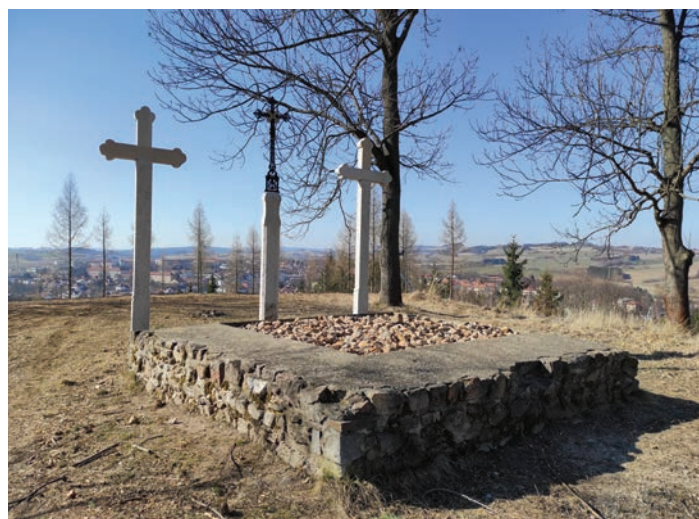
Díky úsilí a péči města se otevřel krásný výhled na Bystřici z Šibeniční hory, jak tomu bylo v minulosti.