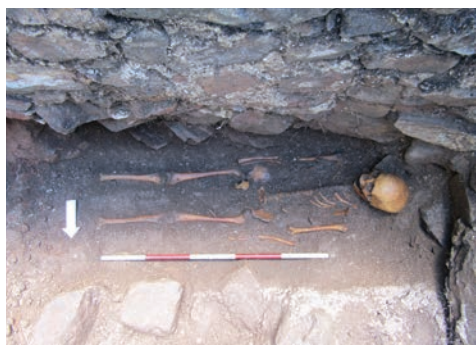
Velkým překvapením byl nálezy hrobu 12 až 13letého chlapce na dně šibenice. Zatím se jedná o zcela ojedinělý nálezy v rámci výzkumu moravských šibenic.