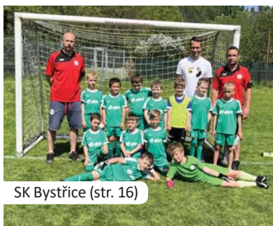
SK Bystřice (str. 16)