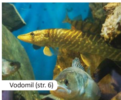
Vodomil (str. 6)