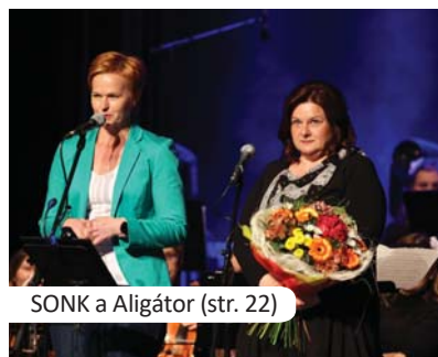
SONK a Aligátor (str. 22)