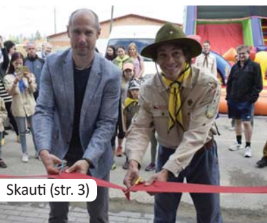
Skauti (str. 3)